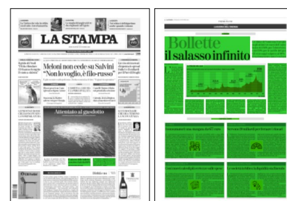
Superficie 82 %

considerare raggiunto l'obiettivo del 90% entro l'autunno fissato dal ministro della Transizione ecologica, Roberto Cingolani. «Che gli stoccaggi nazionali di gas siano arrivati quasi al 90% è una buona notizia - spiega ancora Tabarelli -, ma non ci permette di essere completamente tranquilli per l'inverno. Non potremo ancora contare sul nuovo rigassificatore di Piombino e sull'aumento della produzione nazionale. Se la Russia dovesse chiudere del tutto i rubinetti, la situazione sarebbe ancora più difficile». Per evitare il razionamento, il governo ha varato un piano di risparmi del gas per questa stagione fredda: meno